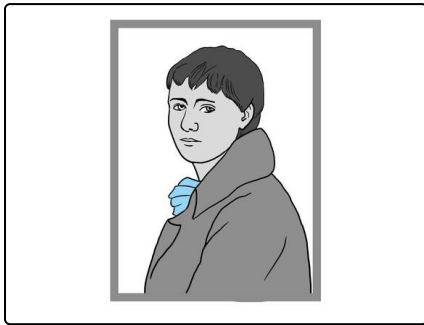
Heinrich von Kleist (1777-1811)

Fülle die Lücken mit den richtigen Elementen aus.