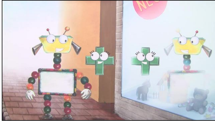
Bild und Spiegelbild

Arbeitsblätter zum Ausdrucken von sofatutor.com